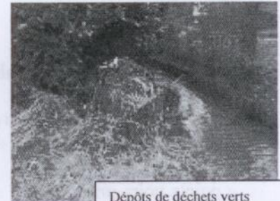
Dépôts de déchets verts

Les Contrats de rivière* Dyle et Gette ont réalisé un inventaire des atteintes aux cours d'eau. Ces atteintes problématiques, dites «points noirs» ont été sélectionnées par les partenaires des deux contrats de rivière. Ces « points noirs » sont répertoriés en différentes catégories: de rejets d'eaux usées dans les cours d'eau (rejets d'égout public ou rejets d'habitations particulières), de dépôts de déchets (immondices, organiques, inertes, mixtes...), d' entraves à l'écoulement des eaux (arbres ou barrage en travers du lit), d' ouvrages d'art dégradés (ponts, murets,...), d' érosion de berges (naturelle ou due au piétinement par le bétail) ou de massifs de plantes invasives le long des cours d'eau. Suite à cet inventaire, les données ont été cartographiées et transmises pour informations aux différents gestionnaires des cours d'eau.