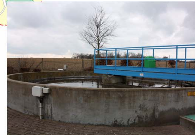
STEP de La Bruyère

Le plan d'assainissement pour le bassin Dyle-Gette a été adopté par le Gouvernement wallon le 10 novembre 2005. La cartographie du PASH représente les égouts, collecteurs et stations d'épuration sur tout le bassin. On y distingue les canalisations et infrastructures existantes et celles qui sont encore à construire. La cartographie représente aussi les différentes zones d'assainissement (régime d'assainissement collectif, autonome ou transitoire). Les obligations de chaque habitant du bassin en matière de gestion de ses eaux usées s'en trouvent ainsi clarifiées. Plus d'infos : www.spge.be