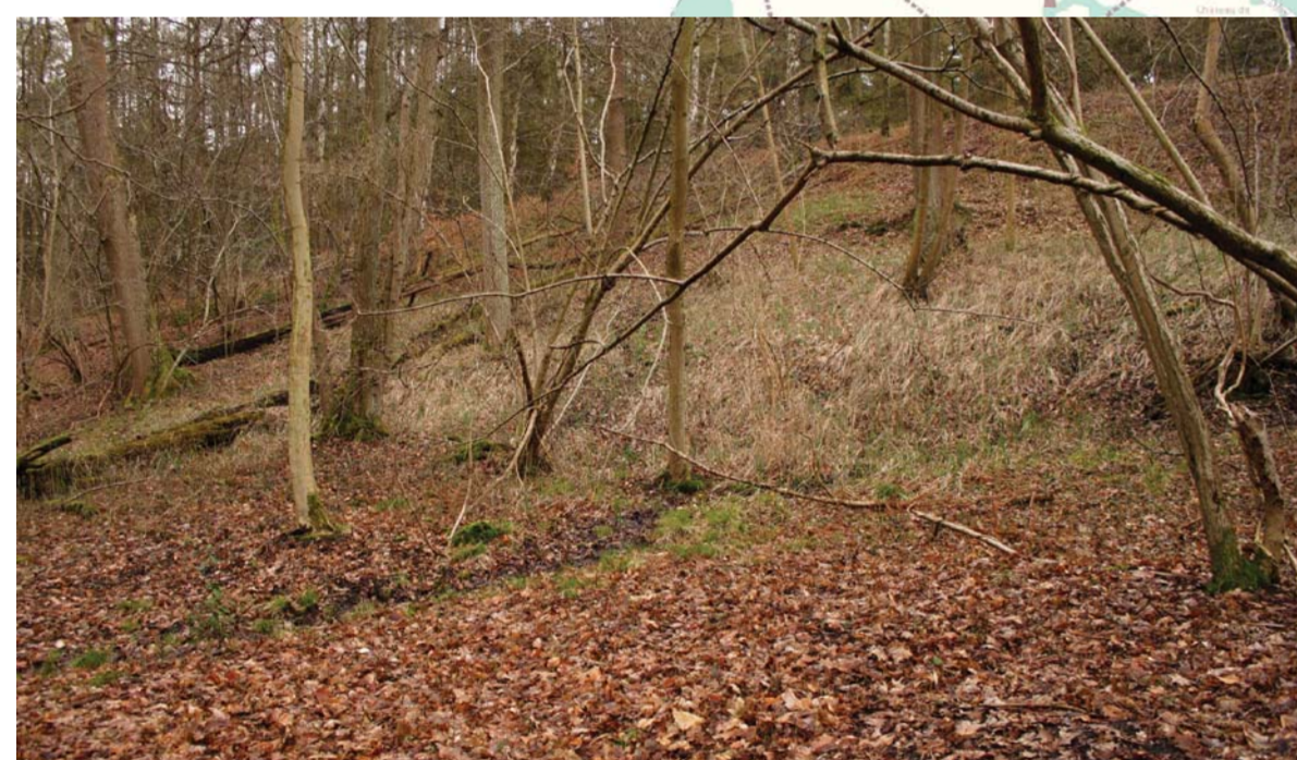
Vallée des Gottes