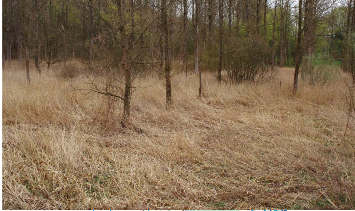
Affluent de la Néthen

Les différents instruments légaux qui permettent de protéger les zones humides sont issus soit de la législation sur la conservation de la nature (réserve naturelle, zone humide d'intérêt biologique,...) soit de celle de l'aménagement du territoire (zone d'espaces verts ou site classé au plan de secteur, plan communal d'aménagement, permis d'urbanisme...). Le contrat de rivière invite ses partenaires communaux et associatifs à démarcher auprès des propriétaires des zones humides qui ne sont pas protégées juridiquement, pour les sensibiliser et créer de nouvelles zones protégées, et ce en respectant le souhait des propriétaires et en collaboration étroite avec les agents forestiers de la Région wallonne.