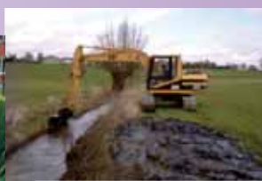
Mettre en œuvre un plan d'entretien global des cours d'eau