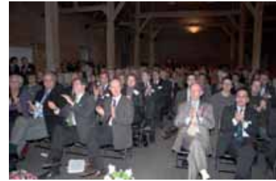
Près de 200 personnes, partenaires et sympathisants, ont assisté à la cérémonie de signature