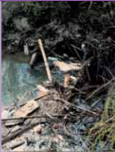
Supprimer les entraves dommageables sur les cours d'eau