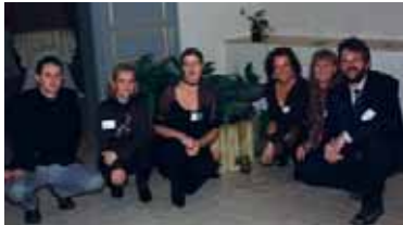
La cellule Contrat de rivière du CCBW

La Région wallonne, la Province du Brabant wallon, le Centre culturel du Brabant wallon, les intercommunales IBW et IECBW, la Société wallonne des Eaux, Vivaqua, les communes de Beauvechain, Chastre, Chaumont-Gistoux, Court-St-Etienne, Genappe, Grez-Doiceau, Incourt, La Hulpe, Lasne, Mont-St-Guibert, Ottignies-LLN, Rixensart, Walhain, Waterloo et Wavre, Action Environnement Beauvechain, ADESA, les Amis du Parc de la Dyle, l' Association des Entreprises de Wavre, le Centre Documentation de La Motte, la Chambre de Commerce et d'Industrie du Brabant Wallon, Chastre Biodiversité, le Comité de Vigilance de Chaumont-Gistoux, le Comité régional Phyto, le Groupe Contrat de rivière Argentine, Environnement Dyle, l' Entente Nationale pour la Protection de la Nature, la Fédération Générale des Travailleurs de Belgique, la Fédération des Pêcheurs du Bassin de la Dyle, la Fédération sportive des Pêcheurs Francophones de Belgique, la Fédération Wallonne de l'Agriculture, le Groupe Sentiers de Chaumont-Gistoux, Lasne Nature, la Truite grézienne, le Brochet de la Dyle, la Ligue des Familles, le Mouvement Ouvrier Chrétien, Natagora Brabant wallon, Nitrawal, le Patrimoine Stéphanois, PhytEauWal, les Pêcheurs de La Roche-Tangissart, les Pêcheurs de l'Orne, l' Union wallonne des Entreprises, les Universités de Bruxelles, Gembloux, et Louvain.