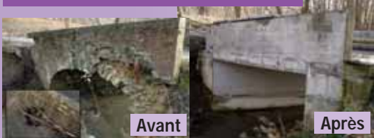
Réparer les ouvrages d'art dégradés