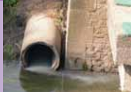
Supprimer les rejets d'égouts dans les cours d'eau