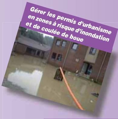
Gérer les permis d'urbanisme en zones à risque d'inondation et de coulée de boue