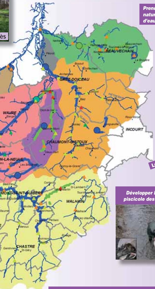
Prendre en compte le patrimoine naturel lors des travaux aux cours d'eau et abords