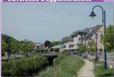
Favoriser l'intégration des cours d'eau dans les traversées d'agglomérations