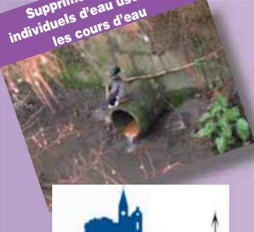
Supprimer les rejets individuels d'eau usée dans les cours d'eau