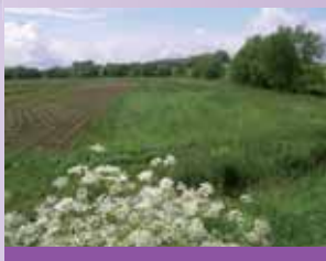
Créer des zones tampons aux abords des cours d'eau

2010 complet administration du contrat de