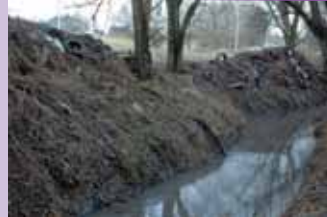
Nettoyer les dépôts de déchets divers le long des cours d'eau