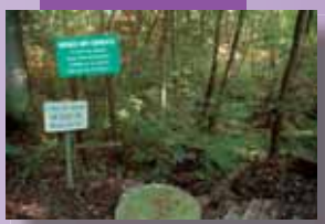
Protéger les captages d'eau