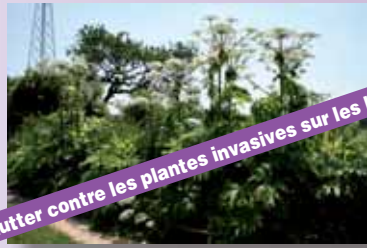
Lutter contre les plantes invasives sur les berges