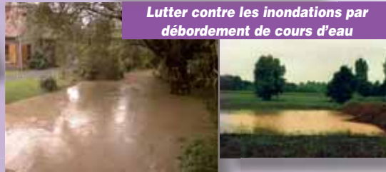
Lutter contre les inondations par débordement de cours d'eau