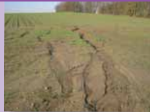
Lutter contre les ruissellements et les coulées de boue et favoriser l'infiltration des eaux