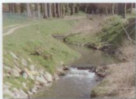
Aménagement de cascates sur le Henry Fontaine (SPW)