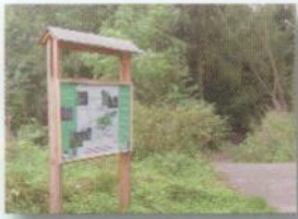
Panneau « La Jaucière » le long du RAVeL (La Petite Jauce + CR Dyle-Gette)