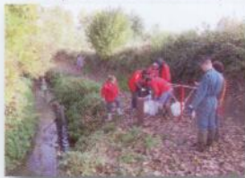
Opération « rivières propres » (Commune + Le Pêcheur Gethois + Unité St-Martin)