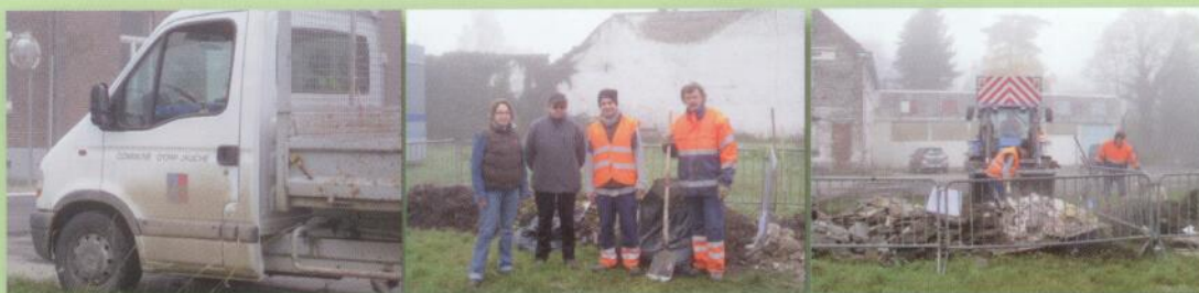
Opération de nettoyage des dépôts de déchets le long des cours d'eau, novembre 2010

Une collaboration fructueuse de tous les citoyens est nécessaire pour améliorer la qualité de nos rivières. Nous faisons appel à vous afin de participer aux futures initiatives qui seront prises dans le cadre du Contrat de rivière .