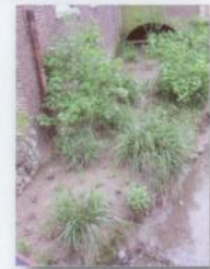
Banquette d'atterrissement sur la Petite Gette