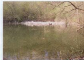
Réserve naturelle du Paradis (Conservatoire Naturel d'Orp-Jauche)