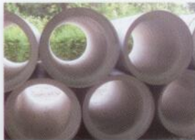
Pose du collecteur d'eaux usées (IBW)