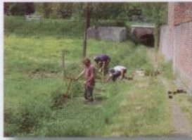
Ecotravaux sur le Ry Cati (Conservatoire Naturel d'Orp-Jauche + CRABE)