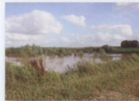
Bassin d'orage de Marilles