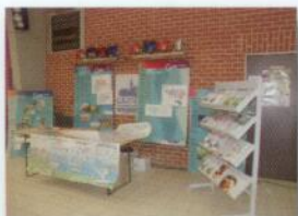
Exposition du Contrat de rivière (La Petite Jauce + CR Dyle-Gette)