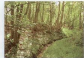
Ruisseau du Village à Nodreng