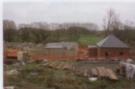
Construction de la station d'épuration d'Orp-le-Grand (IBW)